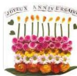
Antoine LINGENHEIM 80 ans Le 11 juin 2017

Nous renouvelons tous nos vœux de bonheur aux heureux jubilaires et leurs souhaitons de vivre encore beaucoup de grands moments comme ceux-là.