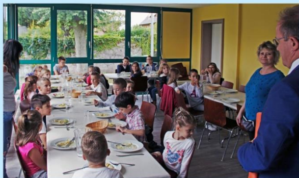
Périscolaire : des places supplémentaires à Oberhoffen-sur-Moder.

Prenons un exemple : au cours de l'été, les demandes d'inscription en périscolaire avaient fortement augmenté dans le secteur de Bischwiller (+36%). Pour y répondre, la CAH a créé à Oberhoffen-sur-Moder 50 places de périscolaires supplémentaires pour les enfants des écoles élémentaires. Une solution mise en œuvre dès la rentrée de septembre.