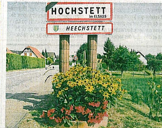
Des fleurs ainsi que des plantes grimpantes et sur monticules ont été installées à l'entrée du village.

Les jours précédant le passage du jury ont également mobilisé Daniel Bourg, un membre de la