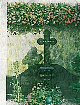
Les fleurs ont aussi embelli le monument aux morts.