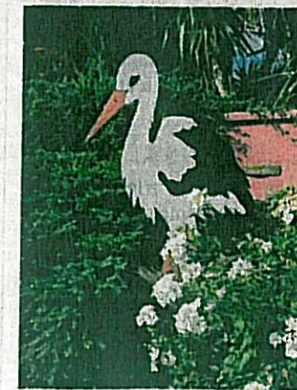
Une dizaine de symboles alsaciens sont à découvrir.